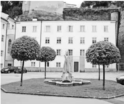
Headquarter Salzburg, St. Peter Bezirk 10

A main step forward was a cooperation with the Salzburg Landesarchiv, that on the occasion of our 25 th anniversary our archive is moving to the Salzburg Archive where it will be kept in an official frame and a book of the 25-years history of the Academy will be published.