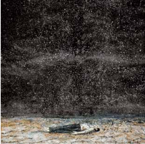
Fig. 1: „Starfall“ Anselm Kiefer

a narrative about Europe's future, a narrative from North, South, East, West, to represent different tendencies of cohabitation and understanding. Academies have confirmed themselves in the narrative, whether in Athens or later in Florence.