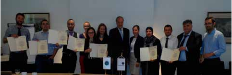
Handing over of certificates in Brussels, July 2015