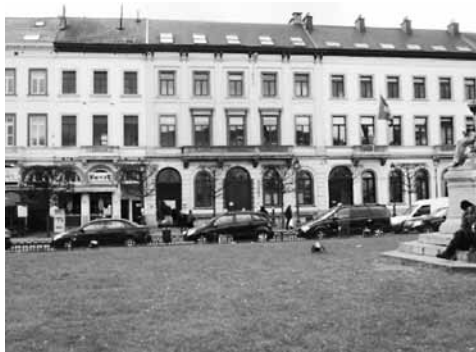
Our representation in Brussels