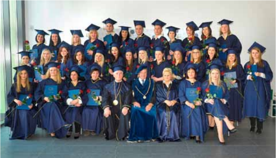
Graduation ceremony in Maribor, March 2015