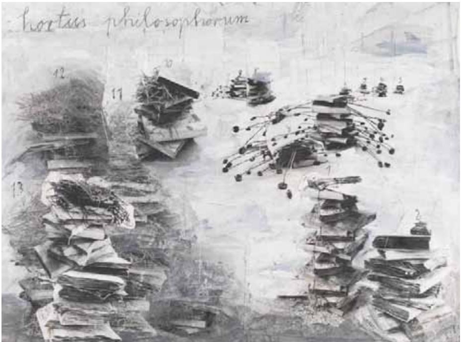
Anselm Kiefer "Hortus philosophorum"

Now the original idea is losing its internal appeal and cohesion. Different ideas collide. Identity difficulties are arising from the rapid overstretching and they create tensions between common interests and national particularities. Although the Euro currency and Schengen is here, the unity for an optimal model of action is missing. This has led to more dissonance than consensus.