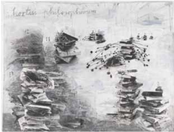
Fig. 2: "Hortus philosophorum" Anselm Kiefer

It is exciting to also ask academies outside of Europe for their contributions. In a further step, European citizens are invited to perceive Europe as a source of narration, of action and of life. A new thrust, a European thrust like a rocket thrust for the future should therefore be created. Discussions are based on free narratives; the results are the basis for the „Next Europe“.